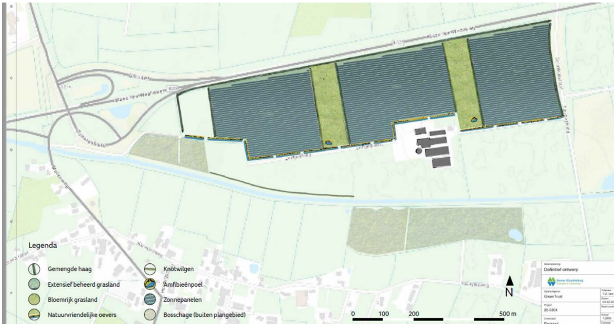
Hierboven het meest recente overzicht van de situatie van Lavendeel.

Er is een rij knotwilgen toegevoegd om het zicht vanuit het 3 meter hoger liggend woongebied te verbeteren. Langs de Maas en Waalweg wordt de haag hoger als eerder vastgesteld en aan de zuidkant komt de beplanting aansluitend aan de rand van het zonnepanelenveld.